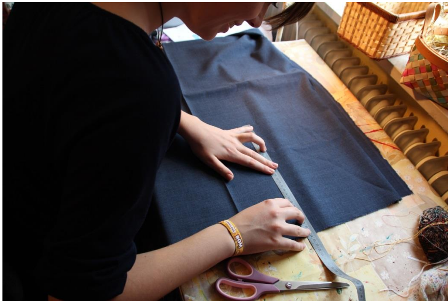
STOFFBREITE ABMESSEN & MIT SCHNEIDERKREIDE ANZEICHNEN