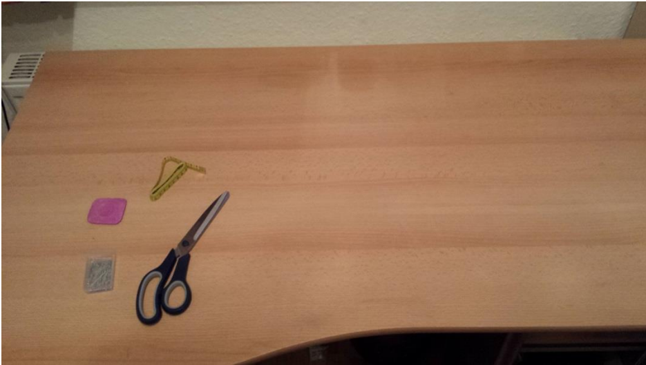
STOFF ZUSCHNEIDEN UND STECKEN